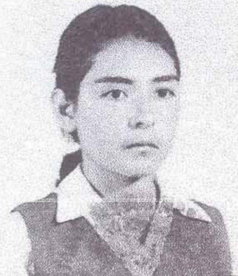
SELLO PARA CANCELAR FOTOGRAFIA