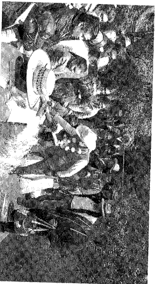
Por la redacción

El Gobierno municipal de Jocotitlán, hizo entrega de la Red de Agua Potable en la comunidad de San Marcos