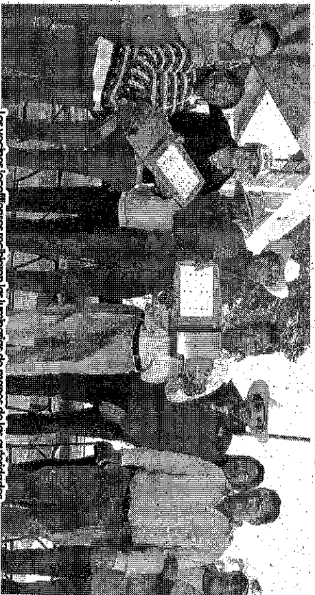
Los vecinos jocotitlenses recibieron las luminarias de manos de las autoridades.