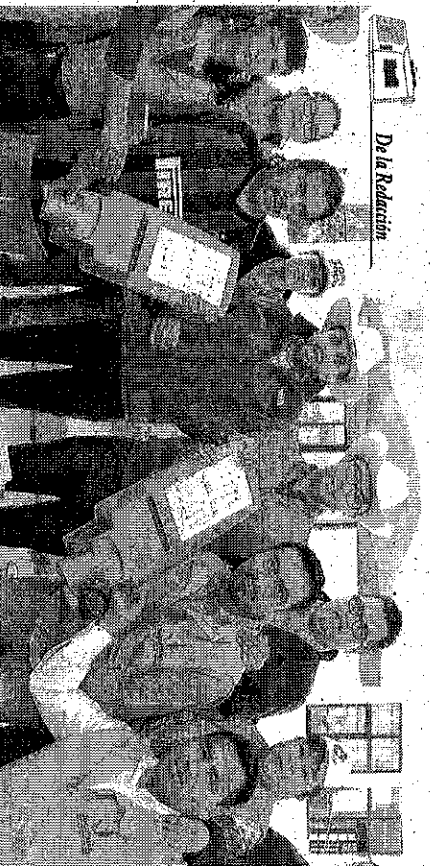
De la Redacción

en to- brinde calles apoyo realiza ante e cifras son e presu por l autori realiza las dis en do este ti