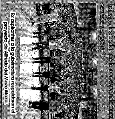
Exaspirantes a la gubernatura respaldaron el proyecto de Alfredo del Mazo Mazza.

y muestras de simpatía en torno a su proyecto.