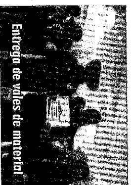
Entrega de vales de material