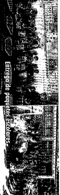
Entrega de paquetes escolares

Es así como podemos dar testimonio de que Iván Esquer ha logrado que gobierno y ciudadanía trabajen en conjunto para seguir construyendo un municipio próspero con mejor infraestructura, calidad de vida y servicios.