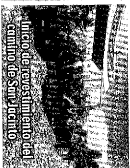
Inicio de revestimiento del camino de San Jacinto