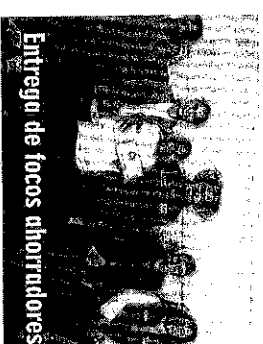
Entrega de focos ahorradores

en el municipio no pasan desapercibidas por ello el edil y su equipo de trabajo han creado un programa especial para la celebración del día de muertos, mismas que permitirán que los jocoitlenses disfruten y participen en esta bella tradición, algunas de las actividades a realizar son: concurso de calaveras literarias, carrera atlética "calaveras a color", concurso de disfraces, concurso de ofrendas, entre otras y por su puesto los jocoitlenses se dicen listos para participar en estas y otras actividades que el gobierno municipal organice.