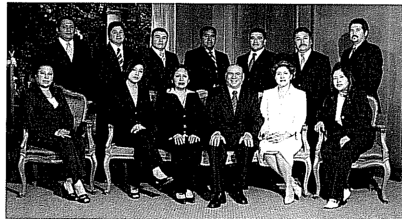
H. AYUNTAMIENTO CONSTITUCIONAL DE JOCOTITLÁN 2009 - 2012

BANDO MUNICIPAL DE POLICÍA Y GOBIERNO 2009 - 2012 Se terminó de imprimir en Enero del 2011 En los Talleres de Impress ubicados en Venustiano Carranza No. 510-BIS Interior 11 Col. Universidad C.P. 50130 Toluca, Edo. de México e-mail: berimpress@yahoo.com.mx