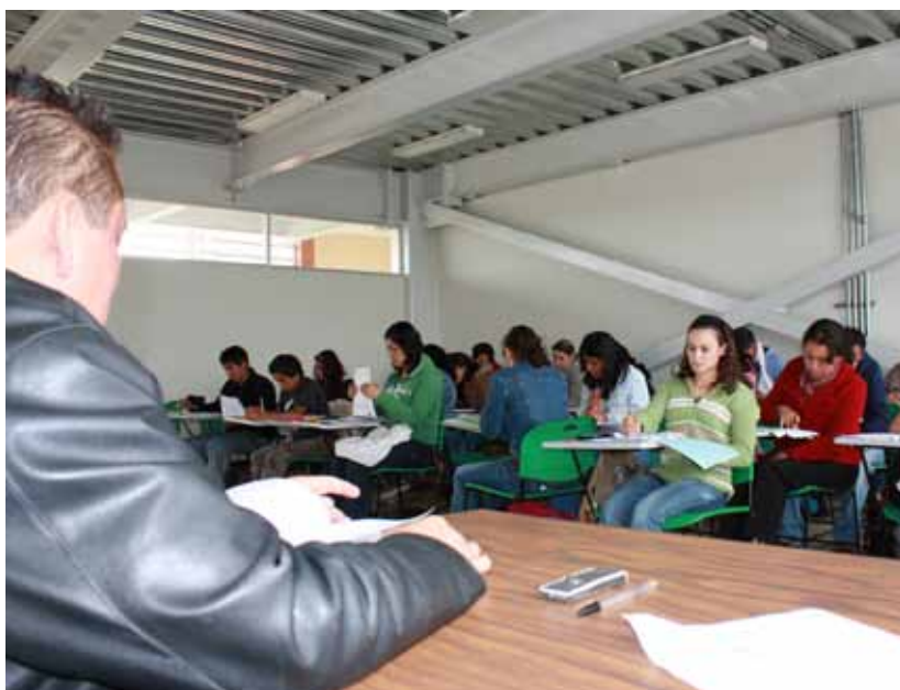
Se cuenta con una planta docente de 601 docentes que imparte clases en la UMB.

Licenciatura, 117 tienen grado de maestría y 6 doctorado. Asimismo, 351 de ellos son hombres y 250 son mujeres.