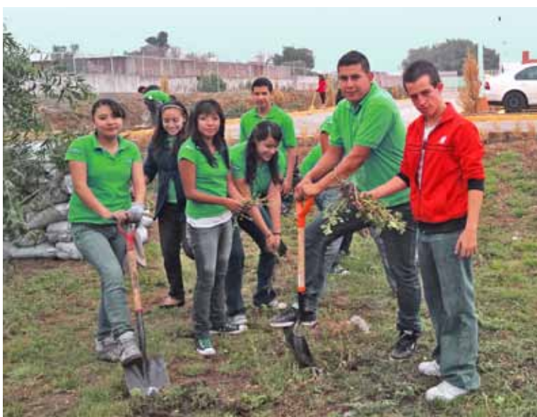
Alumnos de la Universidad Mexicana del Bicentenario, plantan árboles durante su Servicio Social.

vocación de servicio, por lo que una vez adquiridos conocimientos básicos y después de cubrir 50 por ciento de los créditos que conforman su plan de estudios, tienen la posibilidad de aplicar lo aprendido, para ser factor de cambio en una sociedad demandante. Por ello, el “Servicio Social” representa la oportunidad para reafirmar valores como la responsabilidad, el respeto y la solidaridad. Durante el periodo que se informa, se han entregado 309 Constancias de Servicio Social y 151 se encuentran en proceso de liberación.