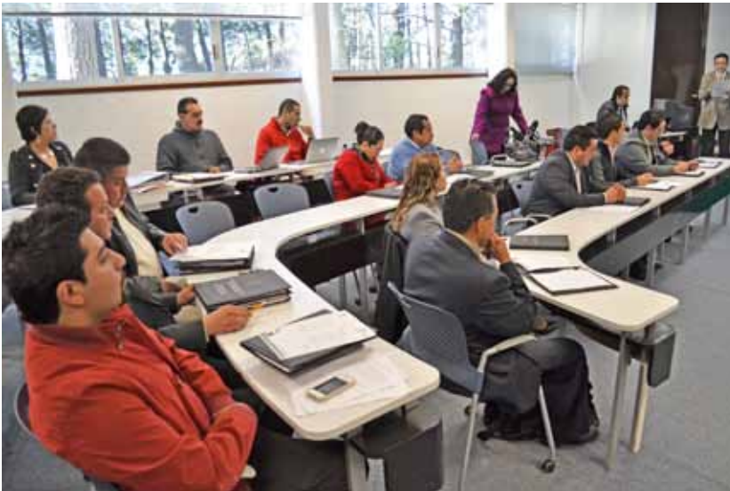
Instalaciones de primer nivel que facilitan el desarrollo de actividades de capacitación.

Lo anterior representó la generación en 2011 de $ 1 millón, 487 mil, 356 pesos como ingresos propios por la prestación de dichos servicios.