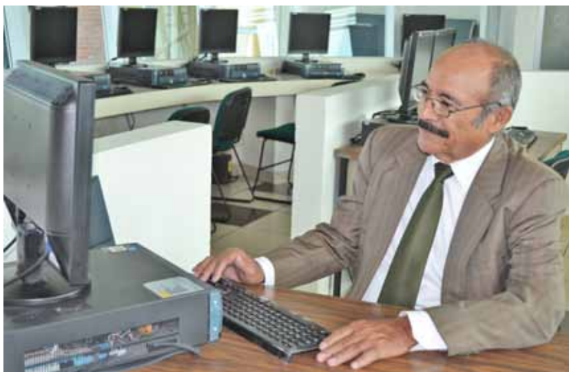
Proyecto “Universidad de la Experiencia”