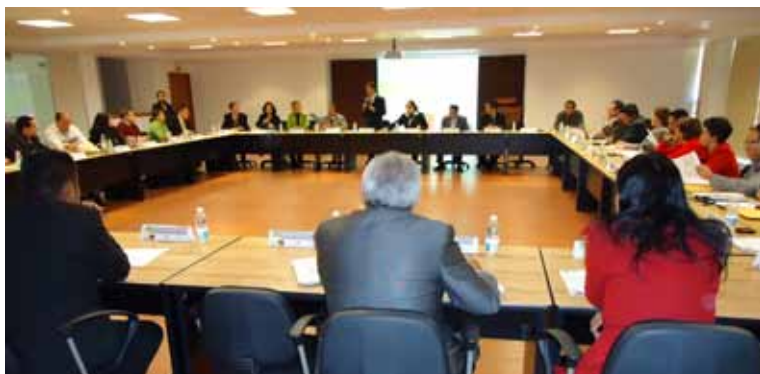
Sesión de Trabajo del Consejo de Coordinadores de la UMB en la Sala de Usos Múltiples de la Rectoría.

Asimismo, de acuerdo con nuestra ubicación geográfica las 28 Unidades se estarán agrupando en 5 grandes Regiones, mismas que representan las áreas de influencia de