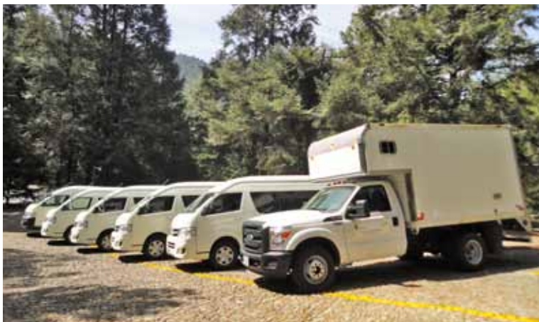
Con el fin de apoyar las actividades académicas, se adquirieron siete camionetas de pasajeros y una camioneta de carga.

En este mismo sentido, se realizó la inversión de $ 2 millones, 148 mil, 603 pesos en equipo de cómputo, audio y video para uso de la Rectoría como de las Unidades de Estudios Superiores.