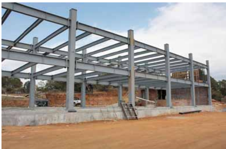
Construcción de nuevas Unidades para ampliar la infraestructura.

Por otra parte, hemos realizado ante la Federación las gestiones pertinentes para obtener recursos extraordinarios provenientes del CONACYT (Ramo 38), de programas como el Fondo de Aportaciones Múltiples (FAM) y el Fondo para Ampliar y Diversificar la Oferta Educativa en Educación Superior (FADOES), los cuales nos permitirán la ampliación y/o construcción de infraestructura física en las Unidades de Estudios Superiores de Acambay, Ecatepec e Ixtapaluca.