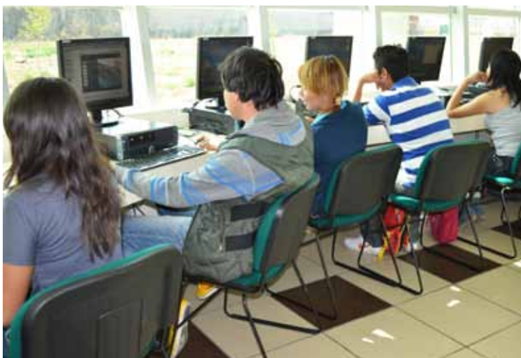
Alumnos de la Universidad Mexicana del Bicentenario utilizan los equipos de cómputo durante sus clases.

Con respecto al equipamiento de salas de cómputo, a la fecha se cuenta con 30 equipos por cada Unidad, con capacidad para atender 240 alumnos por turno, es decir, 840 equipos de cómputo para el uso de la comunidad estudiantil, teniendo un índice de 8.9 alumnos por computadora.