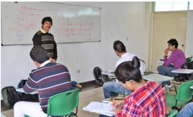
Un docente imparte sus conocimientos dentro de los salones de clases en la Unidad de Estudios Superiores Tultitlán

Con la intención de ampliar nuestra oferta educativa con pertinencia, se realiza el diagnóstico de la demanda respectiva en las diferentes regiones del Estado, registrándose el interés por acceder a las licenciaturas en: Nutrición, Gestión Empresarial, Enfermería e Ingeniería en Tecno-