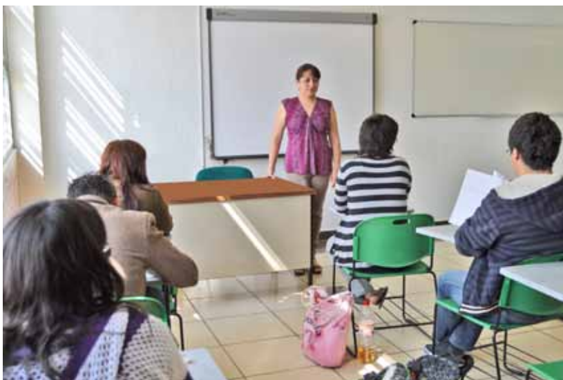
Planta docente capacitada que permita la excelencia académica.

logías de la Información y Comunicaciones; así como la Licenciatura en Psicología Social, Licenciatura en Administración Municipal y Buen Gobierno, Ingeniería Pecuaria, Ingeniería en Robótica, Inteligencia en Negocios e Ingeniería en Energías Renovables.