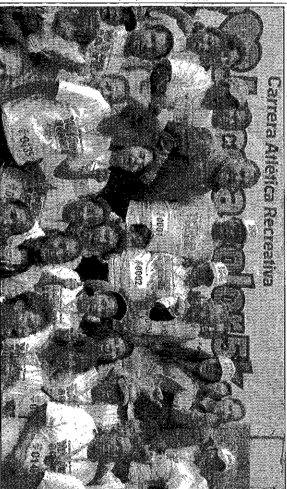
Carrera Atlética Recreativa

Tras pedir a los jocotiltenses seguir sumados a las acciones del gobierno municipal, el alcalde Iván Esquer invitó a los atletas y vecinos del municipio a participar el próximo 29 de octubre en la carrera nocturna a color que se llevará a cabo en el bulevar Emilio Chuayffet de la cabecera municipal, frente a la Plaza Estado de México, recordando que los participantes deben ir maquillados o con atuendos a propósito del Día de Muertos.