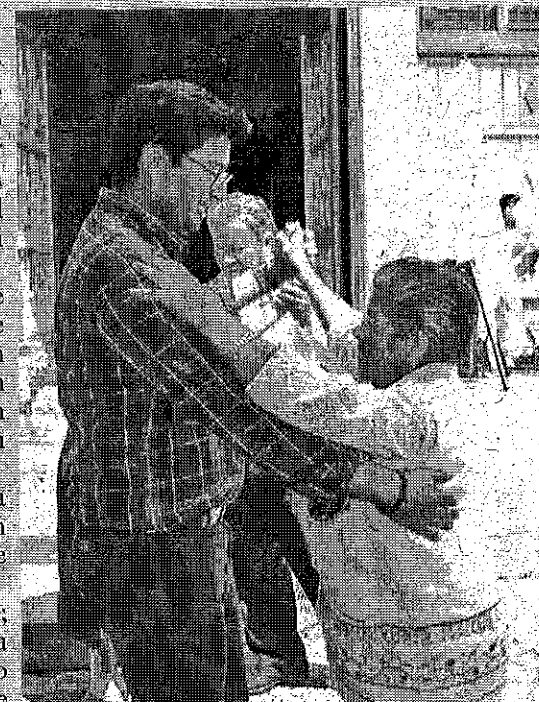
En un ambiente de alegría, el municipio celebró el Día del Abuelito.