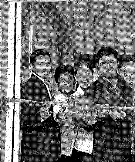
Autoridades municipales cortan el listón inaugural del aula del CBT.