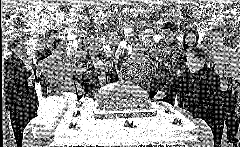
El alcalde Iván Esquer convive con abuelos de Jocotitlán.

Jocotitlán, Méx. - El gobierno municipal encabezado por el alcalde Iván de Jesús Esquer Cruz da atención prioritaria a las escuelas de la demarcación y al mejoramiento de las instalaciones educativas pues es precisamente a través de la educación como se construye una mejor sociedad; en esta ocasión el mandatario local hizo entrega de tres aulas.