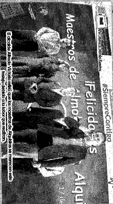
El alcalde Alfredo Victoria refirió que los maestros de Alquisiras se merecen este festejo debido a la labor que realizan.