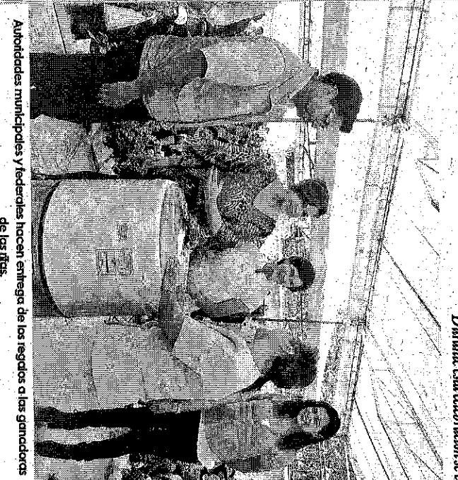
Autoridades municipales y fedatarios hacen entrega de los regalos a las ganadoras de las rifas.

A nombre del Gobernador Erubiel Ávila, Fernando Platas aseveró que las mujeres siempre han sido líderes sociales en el Estado de México y el gobierno estatal se encuentra realizando acciones para favorecerlas, así mismo reconoció al gobierno local que se ha dado cita en las diversas comunidades para festejar a las madres.