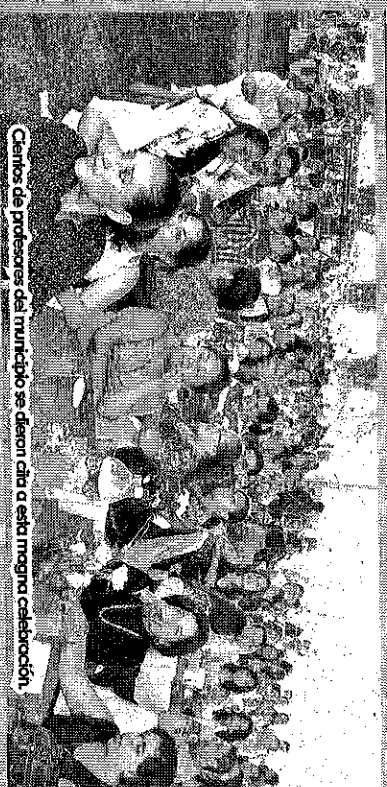
Cientos de profesores del municipio se dieron cita a esta magna celebración.