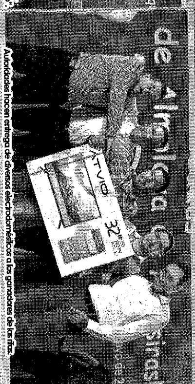
Autoridades locales entregan de ómnibus electrodomésticos a los ganadores de las rifas.