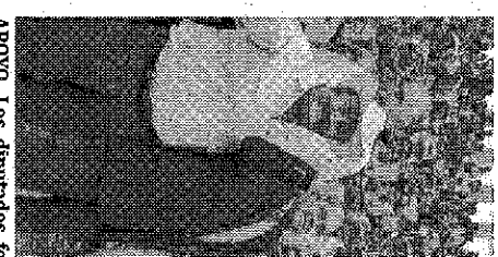
APYOVO. Los diputados federales acudieron a la Cabecera de Tejupilco, a pesar de c México.