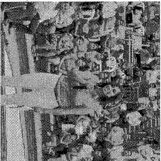
CONTENIA. La funcionaria federal manifestó que su familia ha crecido, con todos los habitantes que le corresponde atender.