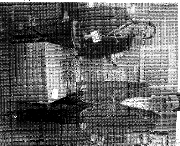
PRESENTES. Las autoridades acompañaron a los artesanos del municipio para recibir los galardones que les otorgó el Presidente de la República.