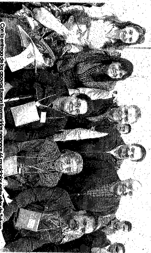
Con la entrega de los aparatos fueron involucradas personas de 66 municipios entre otros de Toluca.