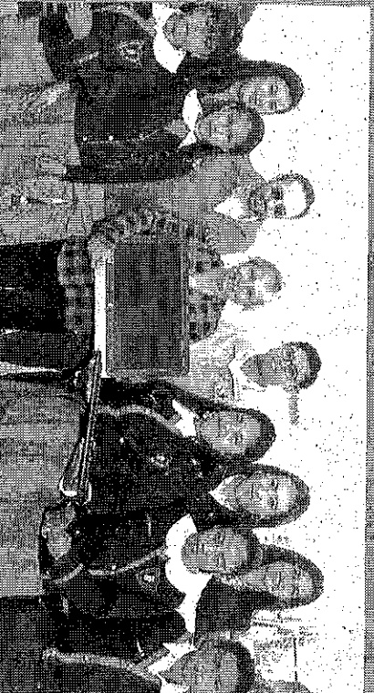
Escuelas del municipio se beneficiaron con equipos de cómputo.