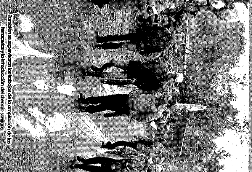
También se supervisaron los trabajos de la ampliación de las tenedurías y la introducción del drenaje sanitario.

Es de resaltar que una de las principales ocupaciones del gobierno estatal ha sido mejorar de forma sustancial las vialidades tanto de la Cabecera Municipal como de las comunidades que hacen parte del territorio jocotitlanense.