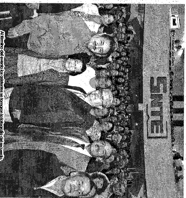
Al término del evento los asistentes se tomaron la fotografía del recuerdo.