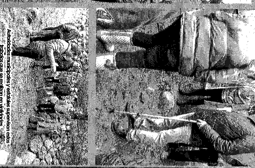
Autoridades municipales y entidades supervisoras en estos trabajos que se realizan en Vialidades.