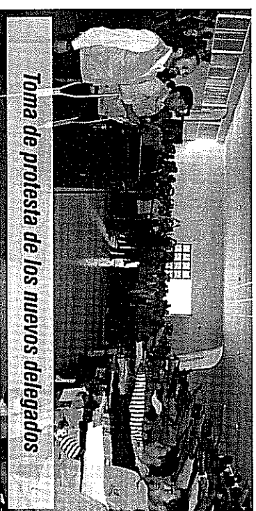
Toma de protesta de los nuevos delegados