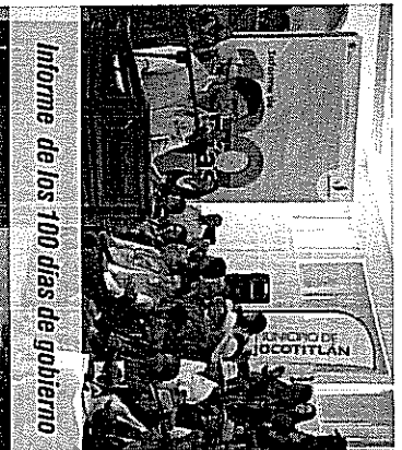
Informe de los 100 días de gobierno

Los resultados son visibles y los jocotitlenses están seguros de que su alcalde los llevará por un camino lleno de éxito, mejor calidad de vida, obras y objetivos cumplidos que beneficiarán a cada uno de los ciudadanos de este bello municipio..