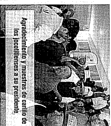
Agradecimiento y muestras de cariño de los jocotitlenses a su presidente