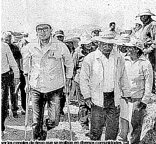
Por los canales de riego que se realizan en diversas comunidades.

nte una gira en la que supervisó los canales de riego; el mandatario local se comprometió a seguir apoyando al sector agrícola