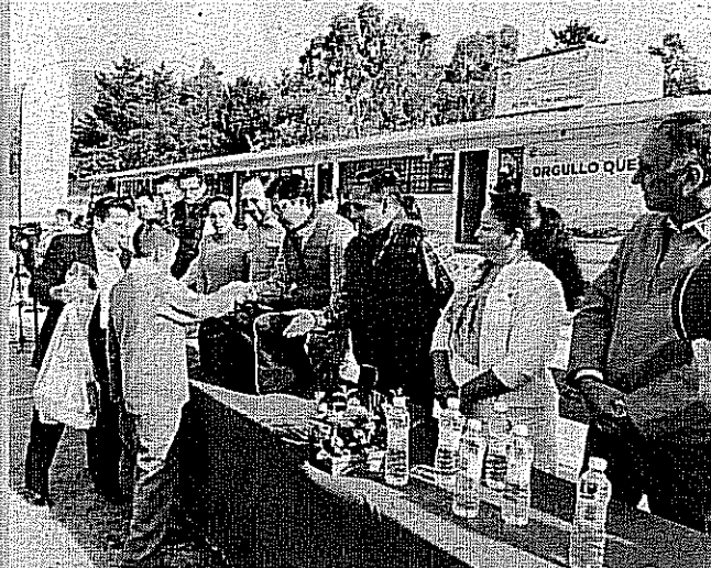
Escuelas del municipio fueron beneficiadas con la entrega de kits deportivos y material didáctico.