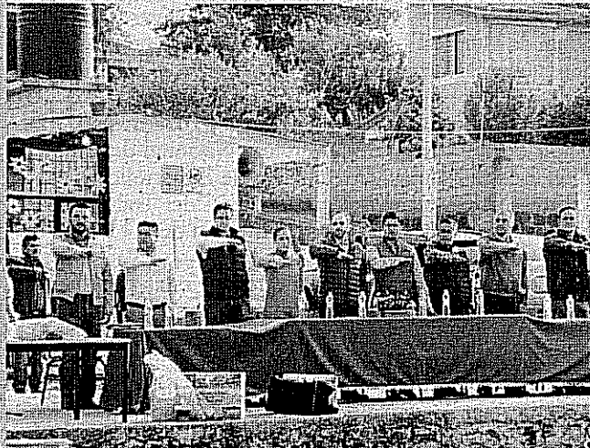
Alumnos y autoridades realizan honores a la bandera en este evento.