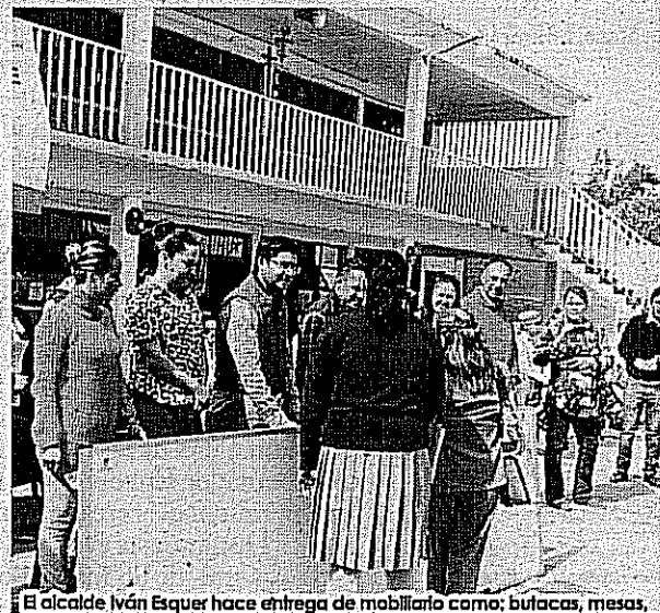
El alcalde Iván Esquer hace entrega de mobiliario como: butacas, mesas, pintarrones, entre otros.

Jocotitlán, Méx.- Con la finalidad de mejorar las condiciones en la que los alumnos de este municipio reciben su educación; el alcalde Iván de Jesús Esquer Cruz llevó a cabo la entrega de mobiliario a escuelas; evento que tuvo lugar en la escuela primaria de tiempo completo Ponciano Arriaga que se ubica en la comunidad de Santiago Yече.