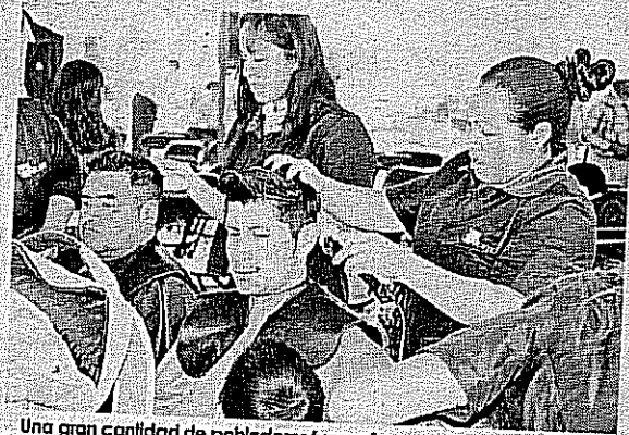
Una gran cantidad de pobladores fueron favorecidos con la jornada multidisciplinaria realizada en Santa María Citendejé.

Consultas médicas, examen de la vista, actualizaciones de actas, cortes de cabello, clases de cocina, asesorías jurídicas, entre otros beneficios: fueron parte de esta jornada realizada en coordinación con el CEDIPEM.