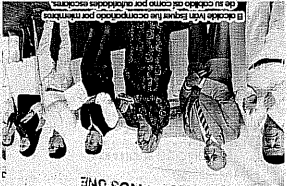
El alcalde Iván Esquer fue acompañado por miembros de su cabildo así como por autoridades escolares.

El alcalde destacó que es a través de la educación como se forja a mejores ciudadanos. Autoridades realizan la entrega simbólica de este mobiliario que tiene como finalidad mejorar las condiciones en la que los alumnos reciben su educación. Cabe destacar que durante este evento las autoridades encabezadas por el presidente municipal