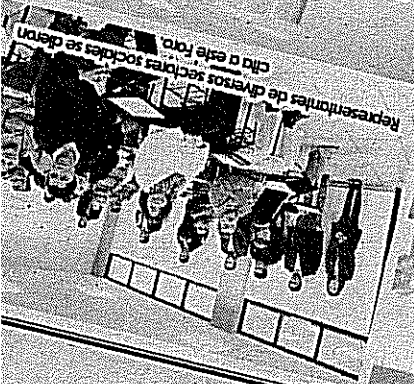
Representantes de diversos sectores sociales se dieron cita a este foro.

... orientadas a subsanar las necesidades ciudadanas