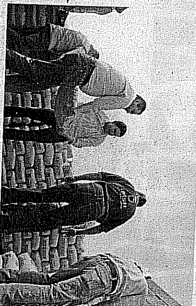
LAMADO. De manera personal, el alcalde hizo entrega de los materiales a los habitantes, a quienes conminó a trabajar con empeño y dedicación.