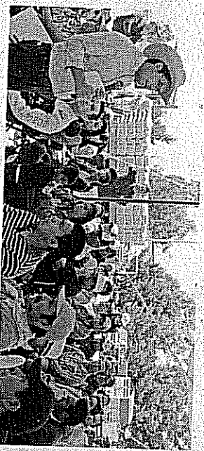
DESARROLLO. Es la hora de poner manos a la obra, refirió el joven alcalde de Jocotitlán, al hacer entrega de cemento para iniciar obras en las comunidades.

Se vieron beneficiadas ocho comunidades, las cuales recibieron cada una, 15 toneladas de cemento.