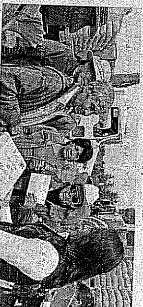
AVANCES. Delegados de las comunidades beneficiadas, agradecieron a la congressista su respuesta en cuanto a la solicitud que le habían planteado sobre el material de construcción.

Señaló que dentro de las estrategias de trabajo, ha sido de gran relevancia mantener estrecha comunicación con las autoridades estatales y federales, para ir dando forma a los proyectos y respuesta a las demandas de la población.