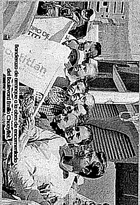
Barrido de arranque a la obra de pavimentación del Boulevard Emilio Chuayffet.

Además el alcalde Iván Esquer dio a conocer que en próximas fechas se dará inicio al Programa de Empleo Temporal a través del cual se busca mejorar las condiciones del municipio y se ofrece trabajo a personas del municipio.