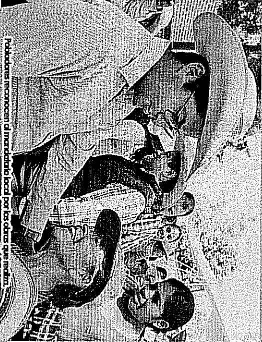
Podoceras recorren el mandatorio local por los obras que realiza.