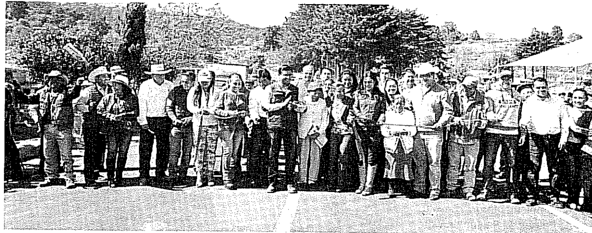
Se concluyen importantes obras en beneficio de El Lindero. Reconocen autoridades estatales en Jocotitlán un ejemplo de trabajo.

Asimismo, Esquer Cruz comentó que el gobernador, Eruviel Ávila Villegas, será un importante aliado de Jocotitlán para concretar importantes proyectos, al igual que el gobierno