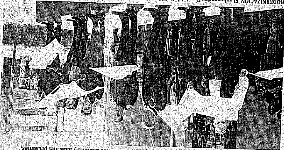
MODERNIZACIÓN. El gobernador, Eruviel Avila Villagas y el secretario federal de Comunicaciones y Transportes, Gerardo Ruiz Esparza dieron el banderazo de inicio a la obra de modernización de la autopista Toluca-Atzacomulco.

Llegan las obras a Coatepec en los primeros días