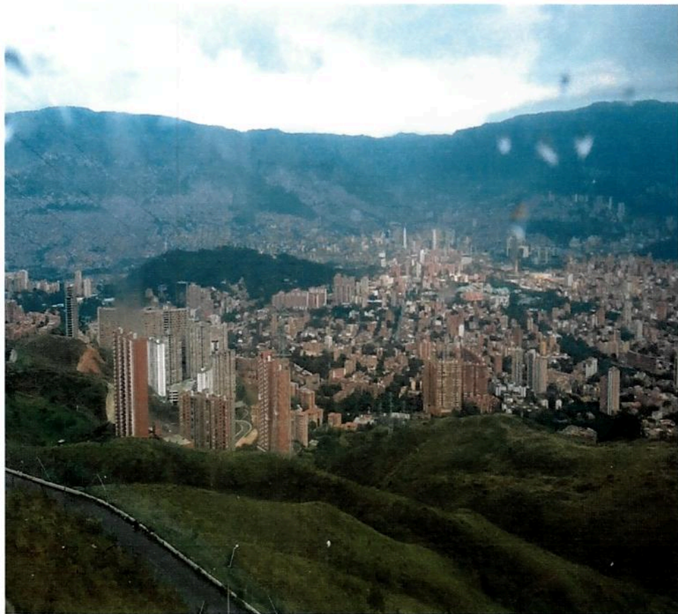
Vista de Medellín en Teleférico