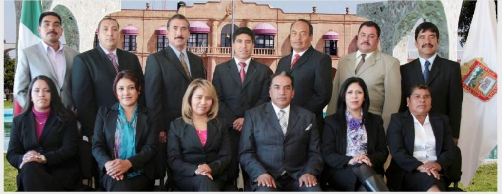
H. CABILDO 2013-2015