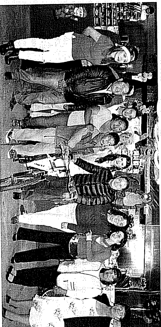
Los infantes de Villa Victoria disfrutaron del festival que el Ayuntamiento y el DIF Municipal prepararon para ellos con motivo del Día de Reyes.

Asimismo, les pidió disfrutar al máximo de esta fiesta, donde no faltaron los juguetes y la rifa de regalos; a su vez, les manifestó el deseo de que en este 2016 gocen de bienestar y salud en sus hogares, para que todos sus deseos se cumplan.