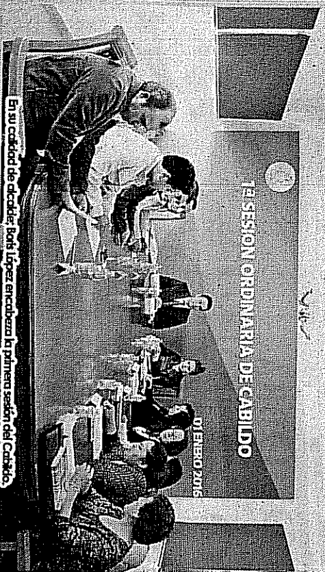
En su calidad de alcalde, Boris López encabeza la primera sesión del Cabildo.