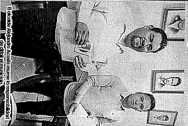
El alcalde Alejandro Acosta asume la responsabilidad de dirigir el municipio.

Z umpahuacán, Méx.- Acompañado por los miembros de su cabildo, el alcalde Alejandro Acosta Medina acudió a la entrega-recepción, acto protocolario a través del cual asumió la administración que dirigirá en el periodo constitucional 2016-2018.