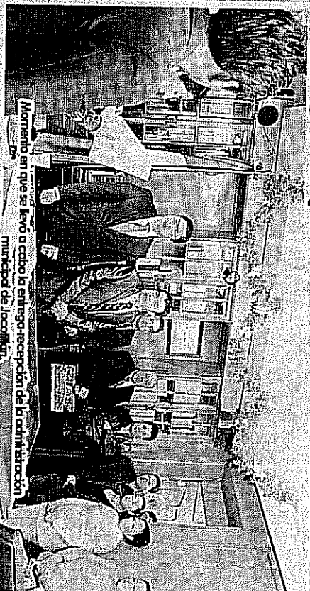
Momento en que se llevó a cabo la entrega-recepción de la administración municipal de Jocotitlán.

J ocotitlán, Méx.- El presidente municipal Iván Esquer Cruz invitó a los integrantes del cabildo a trabajar velando siempre por el progreso y el desarrollo eficaz del municipio, lo anterior al llevarse a cabo la primera sesión de este órgano, en donde se trataron puntos relevantes para el funcionamiento del ayuntamiento, así como para dar una atención más eficiente a la ciudadanía jocotitlense.