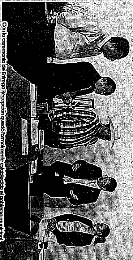
Con la ceremonia de Entrega-Recepción quedó formalmente establecida el gobierno municipal.