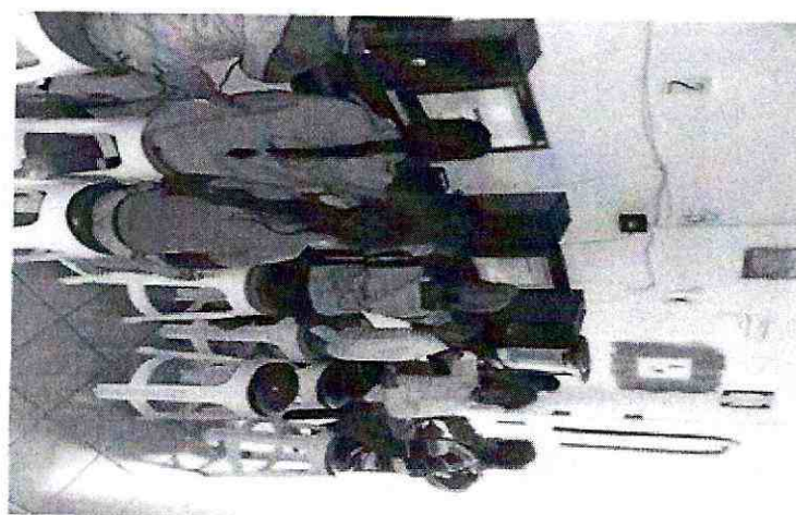
IMAGEN GRÁFICA ACTUAL (27/02/2012)

El programa de escuelas de tiempo completo, ya viene operando en los centros de trabajo referidos. Así, en las 3 horas adicionales al horario regular, se vienen realizando las siguientes actividades: Vida saludable, fortalecimiento de aprendizajes sobre los contenidos curriculares, usos de las TIC'S, arte y cultura, aprendizaje de lenguas adicionales, recreación y desarrollo físico.