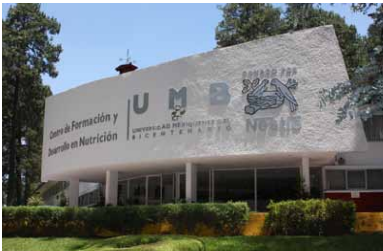
El Centro de Formación y Desarrollo en Nutrición es la sede de diversas actividades de índole público y privado.

Como parte de su actividad sustantiva, en el Centro de Formación y Desarrollo en Nutrición (CEFODEN), se llevó a cabo el “Diplomado Básico en Nutrición”, cuyo objetivo fue dar a conocer las bases teóricas y prácticas de los principios de una alimentación saludable; dicho diplomado concluyó con 12 egresados.