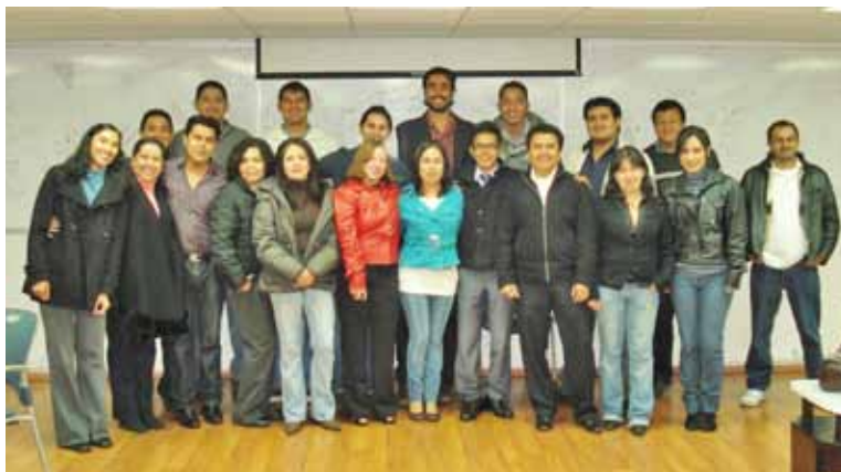
Docentes que participaron en curso para obtener las competencias para la certificación del “Teaching Knowledge Test”.

En tal sentido, se constituyó la Academia de Inglés, para que ésta como parte de sus capacidades, atienda el desarrollo y fortalecimiento de sus integrantes, gestionando, entre otros, la impartición del curso para obtener las competencias para la certificación del “Teaching Knowledge Test” (TKT), en esta actividad participaron 56 docentes de las 28 Unidades.