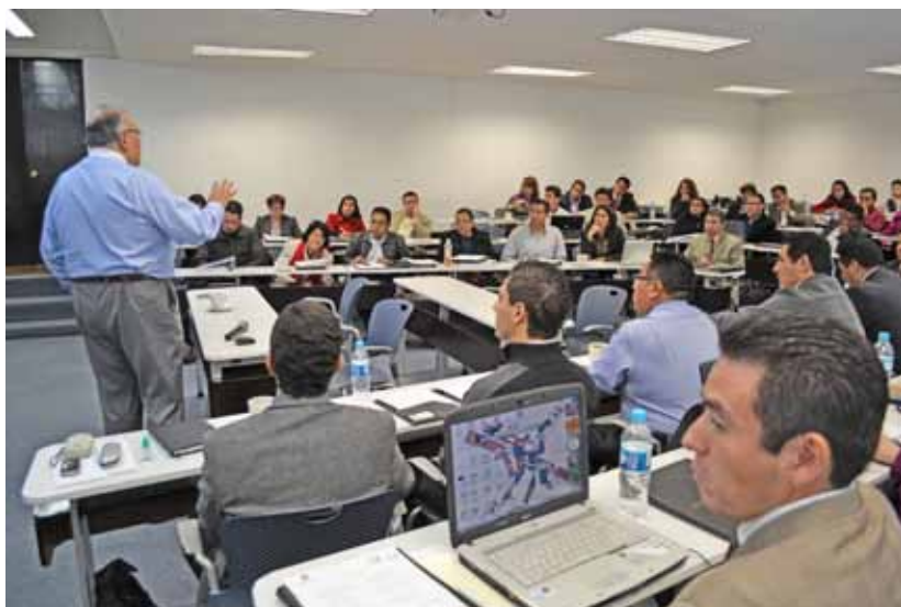
Curso-Taller de Planeación Estratégica”, por parte del Instituto Nacional de Administración Pública (INAP).

Lo anterior, se encuentra estrechamente vinculado con la dinámica promovida por parte de la Subsecretaría de Educación Media Superior y Superior, puesto que estamos participando con el Grupo de Trabajo del Subsistema de Universidades Estatales, para la elaboración de propuestas que integren el Programa Sectorial de Educación en su vertiente Educación Superior para el período 2012-2017.