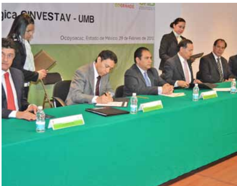
Firma del Convenio de Colaboración entre la UMB y el Cinvestav, participan como testigos de honor el Subsecretario de Educación Media Superior y Superior y el Director General del COMECyT.