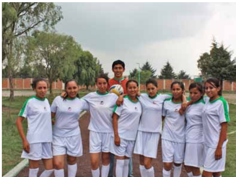
Los integrantes de un equipo de fútbol posan para la foto durante los Juegos Deportivos Inter-Unidades 2011.

Para fortalecer nuestras tradiciones e Identidad Nacionalista, en el marco de las celebraciones del pasado mes de septiembre, se llevó a cabo la Carrera Atlética de la Universidad Mexiquense del Bicentenario que contó con la participación de estudiantes, profesores y administrativos.