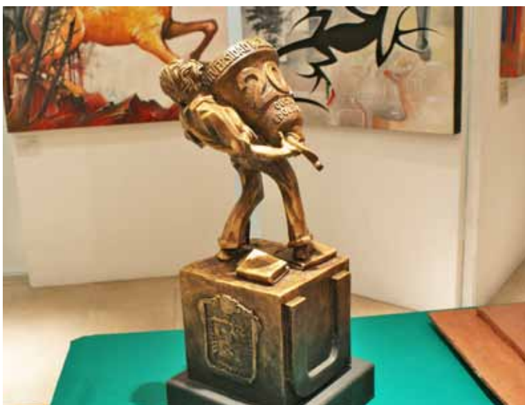
La escultura “El peso de la Libertad” del artista Pancho Cárdenas permanece en las instalaciones de la UMB.

Como parte del fomento a la cultura, se montó en las Unidades una “Exposición Itinerante” conformada por: Pintura, Escultura y Dibujo, obra artística del Maestro Pancho Cárdenas; así mismo, el maestro Cárdenas elaboró 30 réplicas en resina de la escultura “El Peso de la Libertad”, la cual fue creada para la Universidad, en la que se exponen símbolos representativos de nuestra Casa de Estudios. Cada Unidad, recibirá una de estas esculturas, con la finalidad de que sea parte de su acervo cultural.