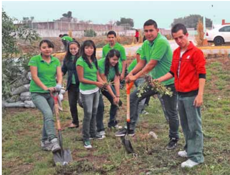
Alumnos de la Universidad Mexicana del Bicentenario, plantan árboles durante su Servicio Social.

siones, tienen además como tarea acentuar en ellos la vocación de servicio, por lo que una vez adquiridos conocimientos básicos y después de cubrir 50 por ciento de los créditos que conforman su plan de estudios, tienen la posibilidad de aplicar lo aprendido, para ser factor de cambio en una sociedad demandante. Por ello, el “Servicio Social” representa la oportunidad para reafirmar valores como la responsabilidad, el respeto y la solidaridad. Durante el periodo que se informa, se han entregado 309 Constancias de Servicio Social y 151 se encuentran en proceso de liberación.