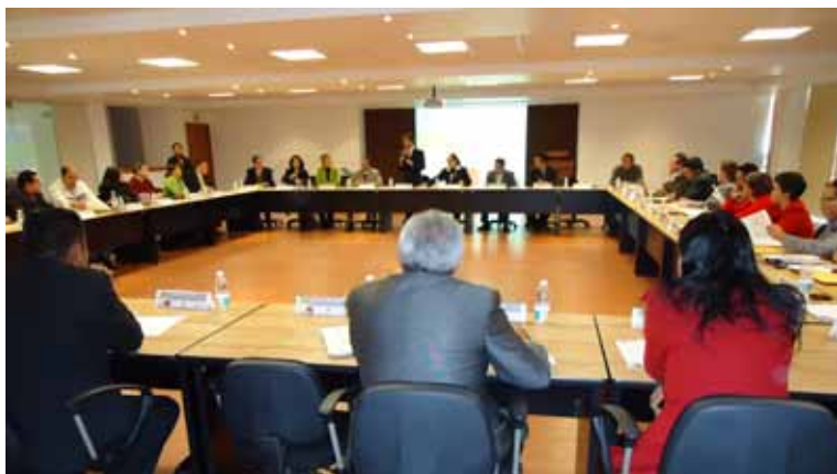
Sesión de Trabajo del Consejo de Coordinadores de la UMB en la Sala de Usos Múltiples de la Rectoría.

Asimismo como parte de la dinámica de este Órgano Colegiado y de acuerdo con su ubicación geográfica, las 28