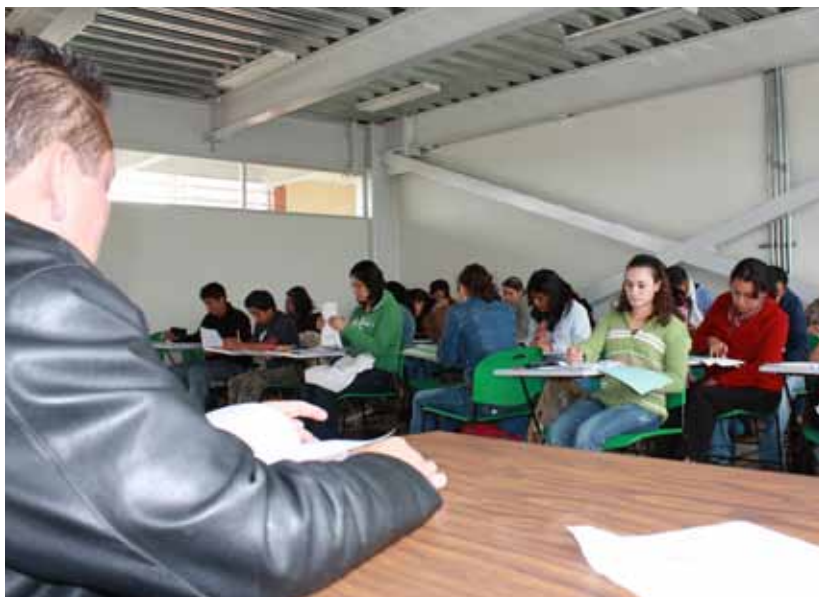
Se cuenta con una planta docente de 601 docentes que imparte clases en la UMB.

Licenciatura, 117 tienen grado de maestría y 6 doctorado. Asimismo, 351 de ellos son hombres y 250 son mujeres.