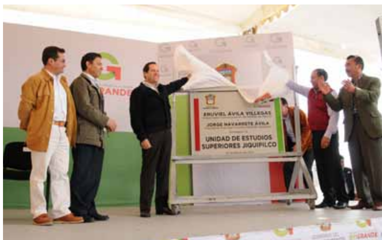
El Gobernador Constitucional del Estado de México inaugura el edificio de la Unidad de Estudios Jiquipilco de la UMB.

La Universidad ha incrementado significativamente su cobertura, estando integrada por 28 Unidades de Estudios Superiores, 22 cuentan con instalaciones propias, lo que representa un déficit en infraestructura del 21.5 por ciento, requerimiento que se considera prioritario dar respuesta, dado que cerca de mil estudiantes son atendidos en espacios provisionales; en este rubro informamos que se encuentra en proceso de construcción la Unidad de Tultepec con un 80 por ciento de avance.