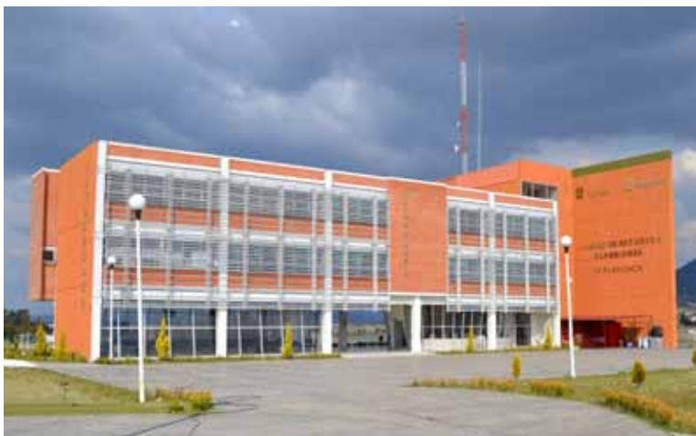
El edificio de la Unidad de Estudios Superiores Ixtlahuaca forma parte de las 22 instalaciones propias de la Universidad Mexiquense del Bicentenario.

Hemos realizado ante la Federación gestiones para obtener recursos extraordinarios provenientes del CONACYT (Ramo 38), de programas como el Fondo de Aportaciones Múltiples (FAM) y el Fondo para Ampliar y Diversificar la Oferta Educativa en Educación Superior (FADOES), los cuales nos permitirán la ampliación y/o construcción de infraestructura física en las Unidades de Estudios Superiores de Acambay, Ecatepec e Ixtlahuaca.