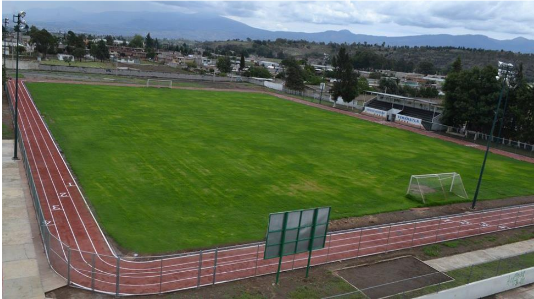
Trota pista de tartán.