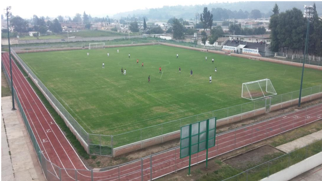
Barda perimetral alrededor de la cancha de futbol.