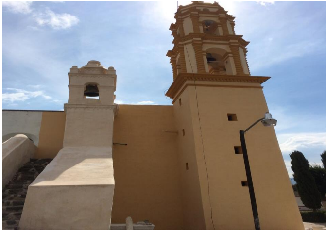
Templo de Santiago Apóstol, Santiago Zula