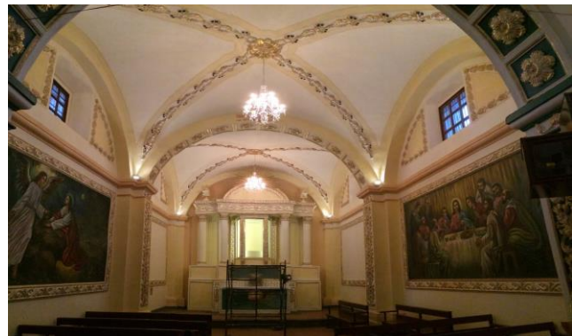
Templo de San Juan Bautista, Cabecera Municipal