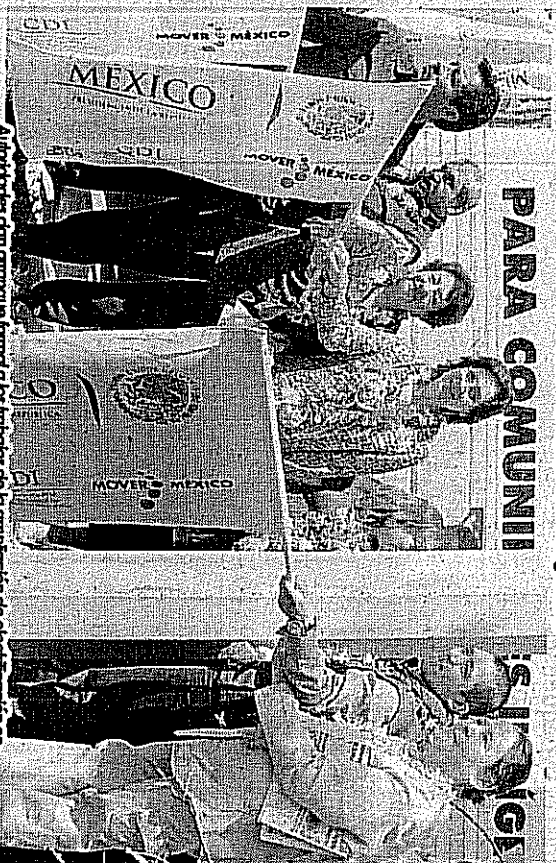
Funcionarios dan arranque formal a los trabajos de la ampliación de electrificación en Santiago Casandéje.