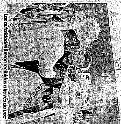
Las autoridades aseron recibida a través de una ceremonia tradicional.