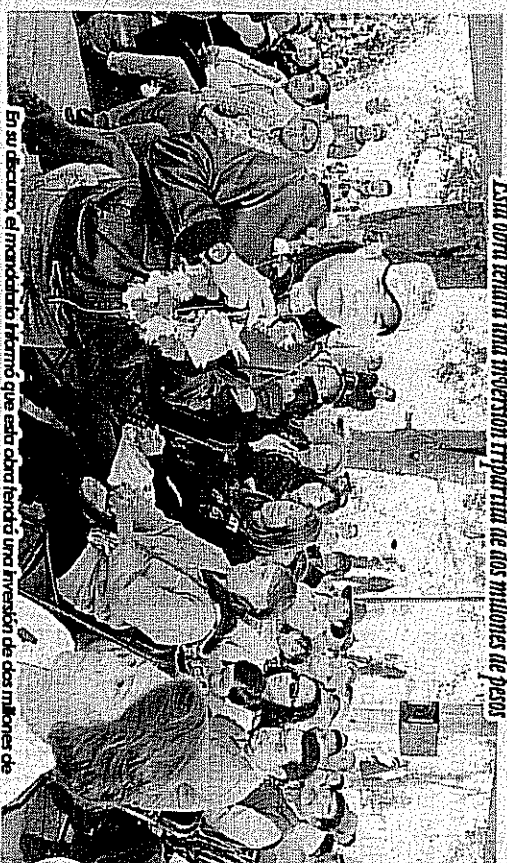
En su discurso, el mandatario afirmó que esta obra tendrá una inversión de dos millones de pesos donde intervienen las tres niveles de gobierno.

Asimismo señaló que hasta el último día de la administración local continuará realizando gestiones para que los recursos sigan fluyendo hacia cada una de las comunidades; además enfatizó en su agradecimiento hacia el mandatario federal Enrique Peña Nieto y al gobernador del Estado de México Erivel Avila Villegas, pues dijo que cuando los gobiernos se alinean, los beneficios para la población son palpables.