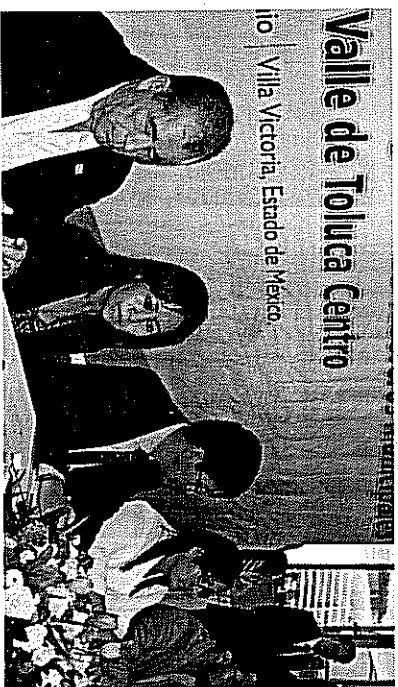
Valle de Toluca Centro Villa Victoria, Estado de México