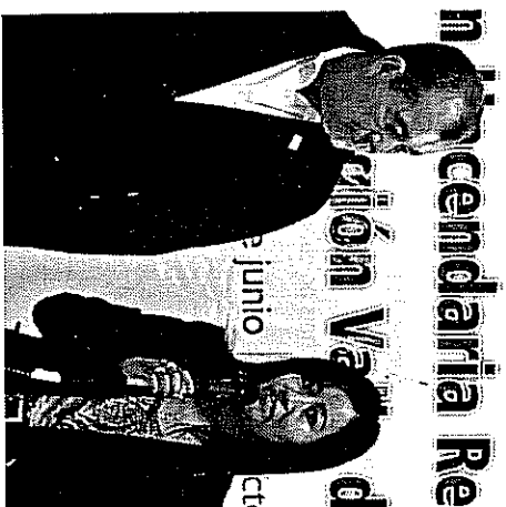
Recepción de la Reunión Valle de Toluca Centro