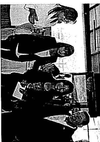
Recepción de la Reunión Valle de Toluca Centro