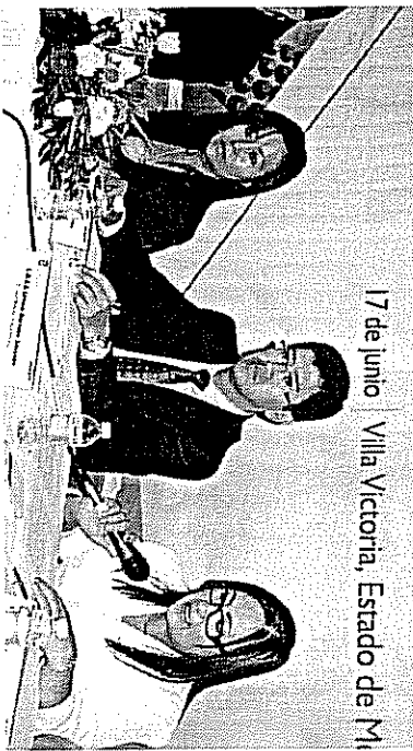
17 de junio | Villa Victoria, Estado de México