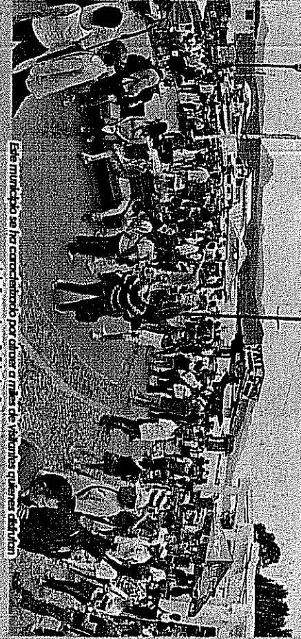
El municipio se ha caracterizado por ofrecer a miles de visitantes quienes disfrutan del centro y hospitalidad vallera.

Las visitantes operaron los atractivos de este Pueblo Mágico y fueron testigos de las diversas actividades realizadas con motivo de la fecha