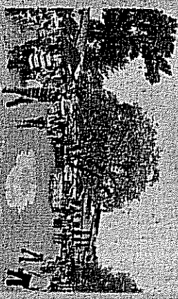
Un ambiente familiar y sobre todo seguro es el que se vive en este municipio del Estado de México.