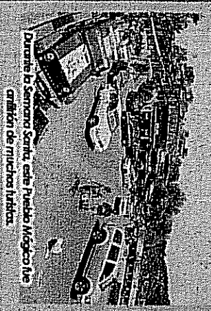
Durante la Semana Santa, este Pueblo Mágico fue cuna de muchas lanchas.

Otros más optaron por admirar el paisaje mientras dieron un paseo en lancha por el lago al atardecer, mientras que a quienes les gusta las emociones más extremas rentaron una canchimoto y condujeron hasta el mirador de la Peña, hubo quienes decidieron aventurarse del parapente, practicaron ciclismo de montaña y para quienes prefirieron un acercamiento con la naturaleza realizaron paseos a caballo.