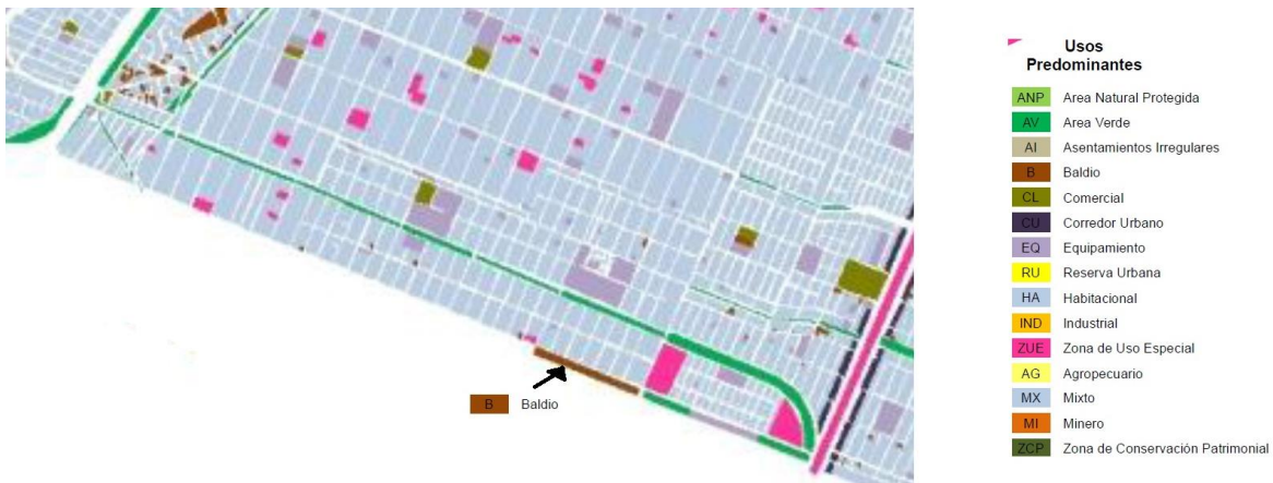
Cartografía correspondiente a las Unidades de Gestión Ambiental, tomada del Decreto de la Gaceta Municipal del 29 de mayo de 2011