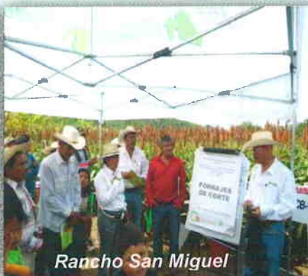
Rancho San Miguel