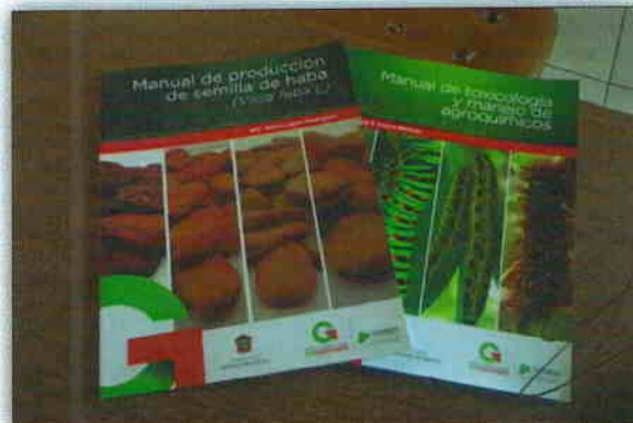
Manual de producción de semilla de haba y Manual de toxicología y manejo de agroquímicos