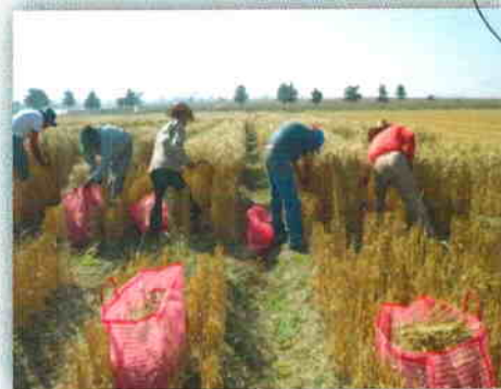
Cosecha manual de trigos con características para altas precipitaciones

Se participó en evento organizado por FUNDECO "Día del pastor" realizado el día 24 de enero en Río Frío, Ixtapaluca, Mex.