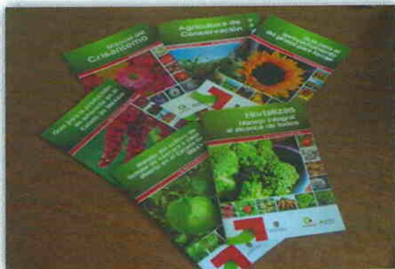
Publicaciones técnicas de diversos cultivos

Se editaron 8 publicaciones técnicas con un tiraje de 1,000 ejemplares cada una