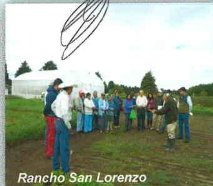
Rancho San Lorenzo