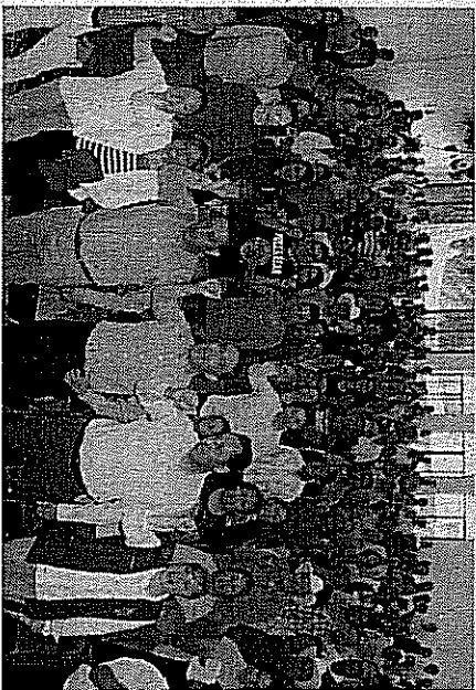
PROYECCIÓN. Los pristas dieron muestra de unidad y respeto a los procesos democráticos, en Alquisiras.