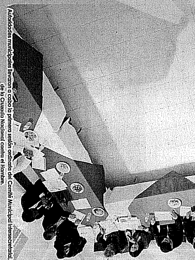
Autoridades municipales llevaron a cabo la primera sesión ordinaria del Comité Municipal Intersecretarial, de la Cruzada Nacional contra el Hambre.