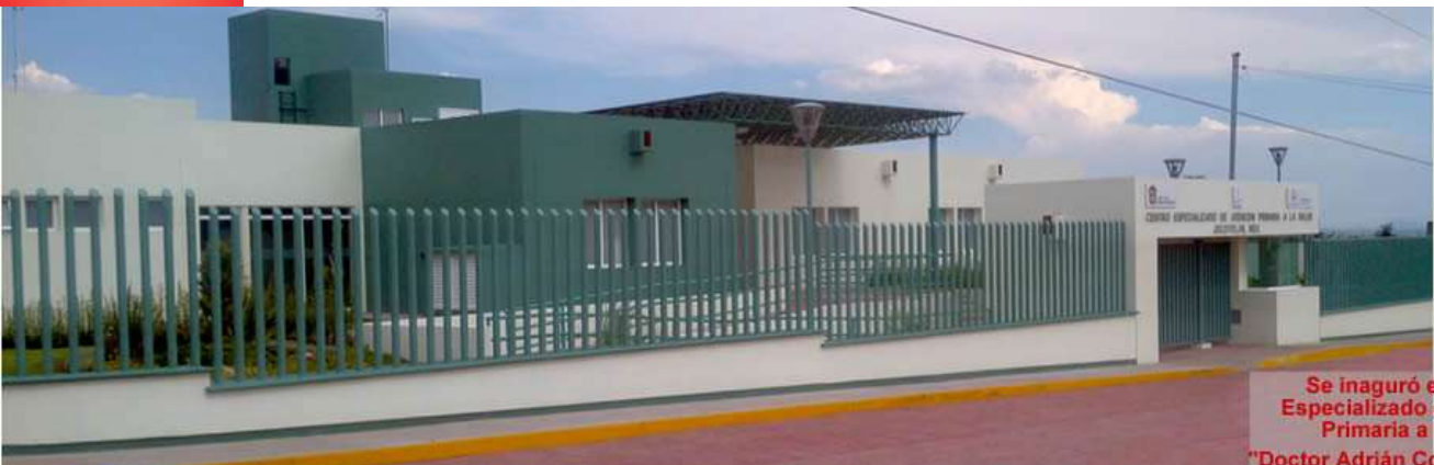
Se inauguró el Centro Especializado en Atención Primaria a la Salud "Doctor Adrián Correa Cedillo"