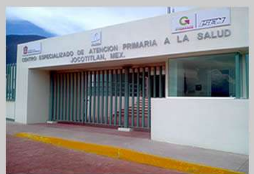
Centro Especializado de Atención Primaria a la Salud