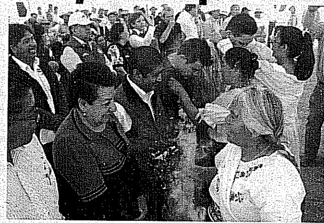
Tradición. Con un ritual a la usanza mazahua, fueron recibidos los funcionarios, a su arribó a la comunidad de Barrio de Guadalupe.