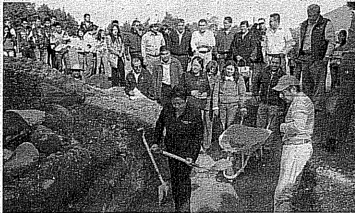
Esfuerzo. Diversas obras de impacto comunitario fueron comenzadas por la administración que gobierna Jocotitlán. En Yeche, dieron el banderazo para la construcción de un aula, en la preparatoria No. 56.