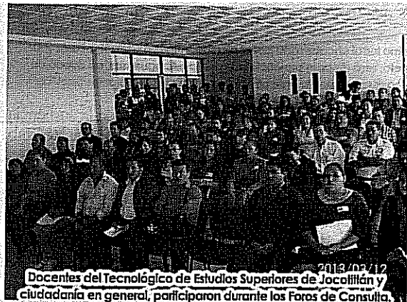
2013/03/12 Docentes del Tecnológico de Estudios Superiores de Jocotitlán y ciudadanía en general, participaron durante los Foros de Consulta.