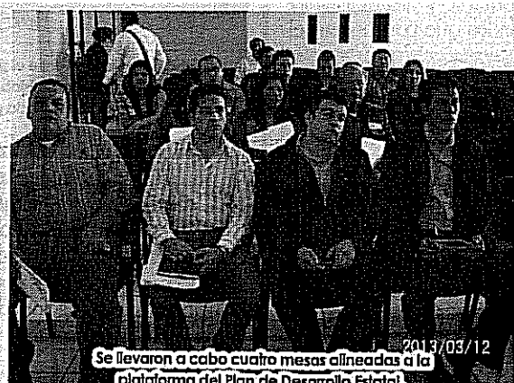
2013/03/12 Se llevaron a cabo cuatro mesas alineadas a la plataforma del Plan de Desarrollo Estatal.