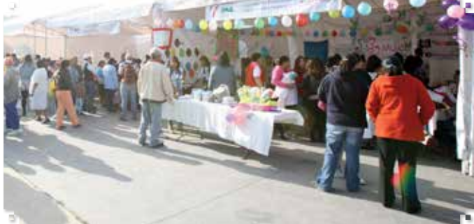
Por: Roberto Rodríguez

“Con gran éxito y una importante participación social, se llevó a cabo la Primera Feria Integral de Prevención Social “Ecatepec por la Paz”, en el aeropuerto Bicentenario, en la colonia Carlos Hank González, con la finalidad de promover y fomentar la cultura de la paz y la legalidad, así como la convivencia social en la ciudadanía.