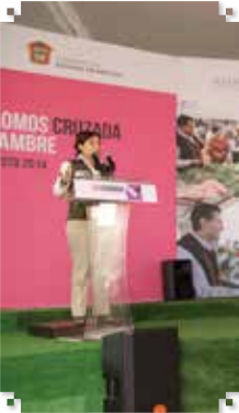
Por: Rebeca Ovando

Como parte de las acciones enmarcadas en el programa de la Cruzada Nacional Contra el Hambre, la secretaria de Desarrollo Social, Rosario Robles Berlanga, acompañada por el gobernador del estado de México, Eruviel Ávila Villegas y el presidente municipal de Ecatepec, Pablo Bedolla López, encabezó una gira de trabajo por el municipio.