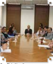
Por: Elvia Abundis

El presidente municipal Pablo Bedolla López entregó equipos de cómputo a los titulares de las 14 oficialías del Registro Civil que hay en Ecatepec; lo que representa una etapa de modernización y por ende, la disminución del tiempo para la entrega de los documentos que expiden en estas dependencias, como actas de nacimiento, de defunción, de matrimonio e inclusive de divorcio.