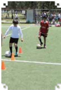
Por: Rebeca Ovando

Las vacaciones han llegado y miles de niños buscan espacios que hagan de éstas un momento inolvidable y para ello, el gobierno de Ecatepec, invita a que visiten los atractivos lugares de esparcimiento con los que cuenta el municipio, donde se promueven y difunden actividades artísticas, culturales y deportivas.