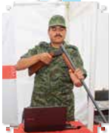
Por: Héctor Mendoza

Con la finalidad de contribuir a la prevención del delito y el fomento a la cultura de la legalidad en Ecatepec, el gobierno local junto con autoridades del estado de México y de la Secretaría de la Defensa Nacional, realizaron por segunda ocasión el programa "Canje de armas 2014" en el municipio.