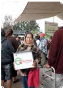
Por: Rebeca Ovando

Para apoyar a 60 mil familias, el gobierno de Ecatepec continúa con la entrega mensual de la “Canasta Básica Alimentaria”, en 15 diferentes puntos de la localidad.