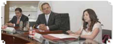
Por: Elvia Abundis

*Firman alcalde de Ecatepec y delegada de Condusef convenio de colaboración.