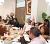
Por: Elvia Abundis

*La reforma fue turnada por la legislatura local al cabildo ecatepequense.