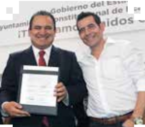
Por: Rebeca Ovando