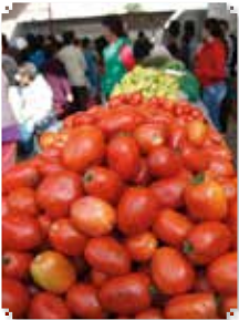
Por: Rebeca Ovando

Con la entrega de productos frescos y de temporada, cosechados en campos mexicanos, el gobierno de Ecatepec, además de apoyar la economía de las familias, contribuye con la sana alimentación de los ecatepequenses al ofrecer frutas y verduras con un alto contenido nutricional, necesario para la salud.