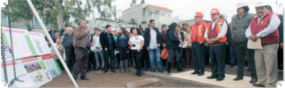
Por: Rebeca Ovando

En Ecatepec ya son más de 300 mil familias las beneficiadas con la dotación de leche Liconsa, cifra que se incrementará con la construcción de 6 nuevos centros de abasto social, llegando a 100 lecherías ubicadas en la localidad, siendo el municipio con más puntos de distribución de este fortificado lácteo en todo el país.