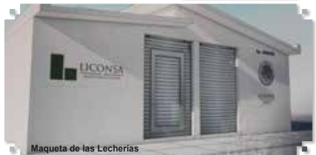
Maqueta de las Lecherías