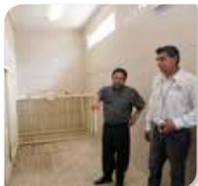
*Inspectores de PROPAEM confirman buena salud y un adecuado entorno para los animales

En una visita por el Parque Ecológico Ehécatl, personal de la Procuraduría de Protección al Ambiente del Estado de México (PROPAEM), en compañía de integrantes de la Dirección de Desarrollo Urbano y Medio Ambiente del gobierno de Ecatepec, confirmaron que las diferentes especies en cautiverio gozan de bienestar y salud en cumplimiento a sus necesidades.