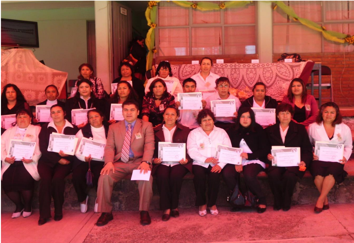
EVENTO: CAMPAÑA “CAMBIOS DE PARADIGMA EN LA PSICOLOGÍA DE LAS MUJERES MALTRATADAS”, CECYTEM PLANTEL JOCOTITLÁN, SANTIAGO CASANDEJE; 29 DE JUNIO DE 2012.