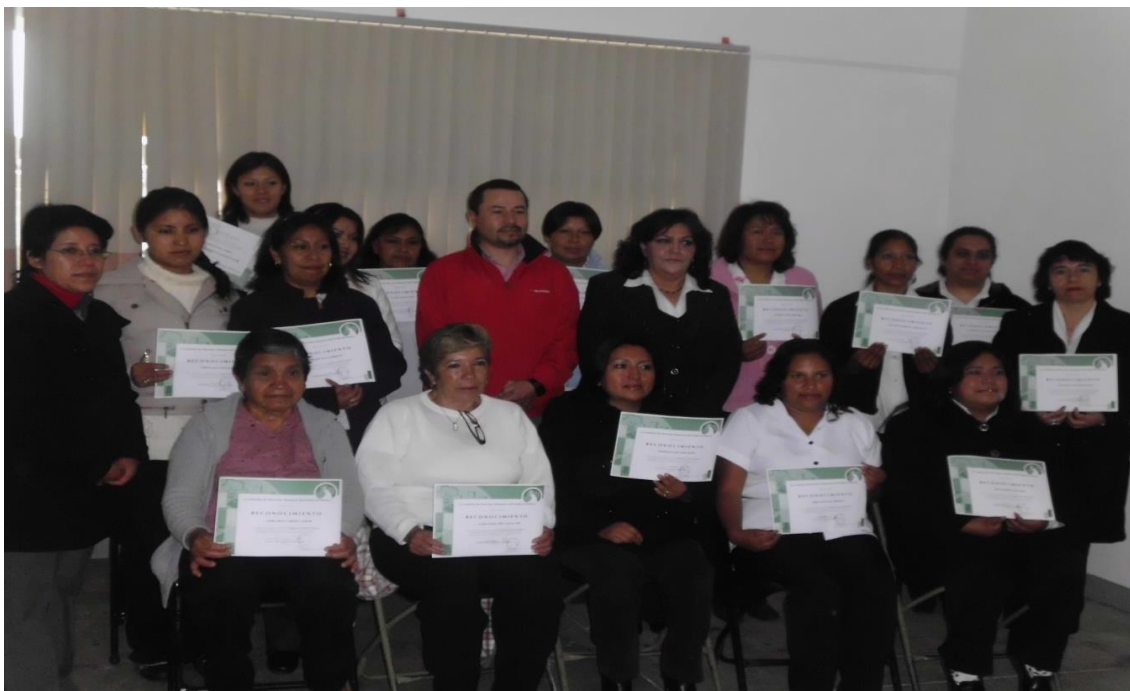
EVENTO: CLAUSURA CÍRCULOS FAMILIARES, ESCUELA PRIMARIA “OSÉ MARÍA MORELOS”, LA PROVIDENCIA; 26 DE JUNIO DE 2012.