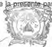
ABOGADO GENERAL DE LA UAEM