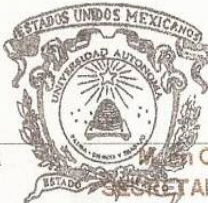
FACULTAD DE CIENCIAS DE LA CONDUCTA H. H. CONSEJO DE GOBIERNO Y ACADÉMICO