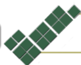
Cuadro 2: Metas cumplidas para la administración por proyecto